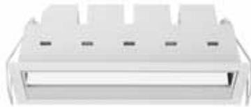
FW5 / 5 LED / 11W / 600 lm