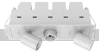
FS1 / 1 LED / 2W / 170 lm