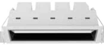
FG5 / 5 LED / 11W / 400 lm